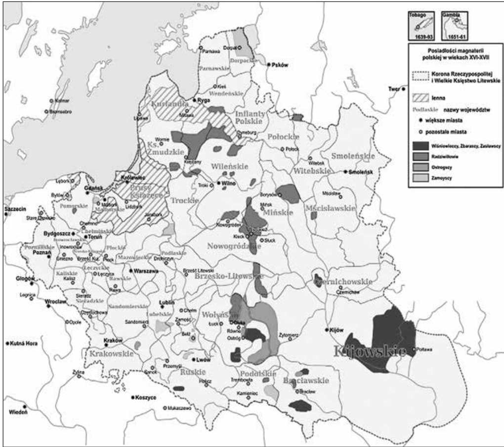
Володіння магнатів Речі Посполитої, в т. ч. Вишневецьких у XVI—XVII ст. Суспільне надбання