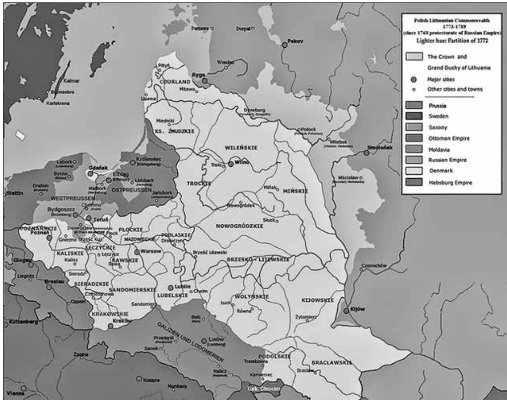
Річ Посполита в кордонах 1772 р. Суспільне надбання

Адекватну узагальнену картину малює Н. Яковенко 1 . Авторитетна дослідниця констатує: станом на початок XIV ст. головними «столами» Південно-Західної Русі — володимирським, галицьким та київським — володіли князі з двох родів: руського, Рюриковичів та литовського, Гедиміновичів. 1340 р. володимирський стіл «унаслідок династичних зв'язків посів син Гедиміна Любарт, одружений з донькою володимирського князя Андрія Юрійовича (Романовича)». Внаслідок успішних воєнних дій проти Орди в 50-х — на початку 60-х років XIV ст. Гедиміновичі утвердили-