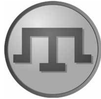
«Тамга» — знак роду Гераїв.

в Україні нерозхитаним. <...> Особу князя і найвище право, носієм якого він уважався вже в силу народження, сприймали як наслідок Божого промислу, незаперечний абсолют». За класичною схемою всі князівські роди Великого князівства Литовського умовно поділялися на чотири групи, кожна з яких мала певне відношення до руських земель: князі литовського походження (в т. ч. представники панівної династії Гедиміновичів), князі руського походження (Рюриковичі), вихідці з татарських орд і Кримського ханату (в т. ч. Чингізиди); князі невстановленого походження. З кінця XIV ст. до середини XVII ст. на теренах Волині та сучасної Центральної України проживало щонайменше п'ятдесят два князівських роди. Особливу місію серед них мали «господарі Русі» — князі Острозькі.