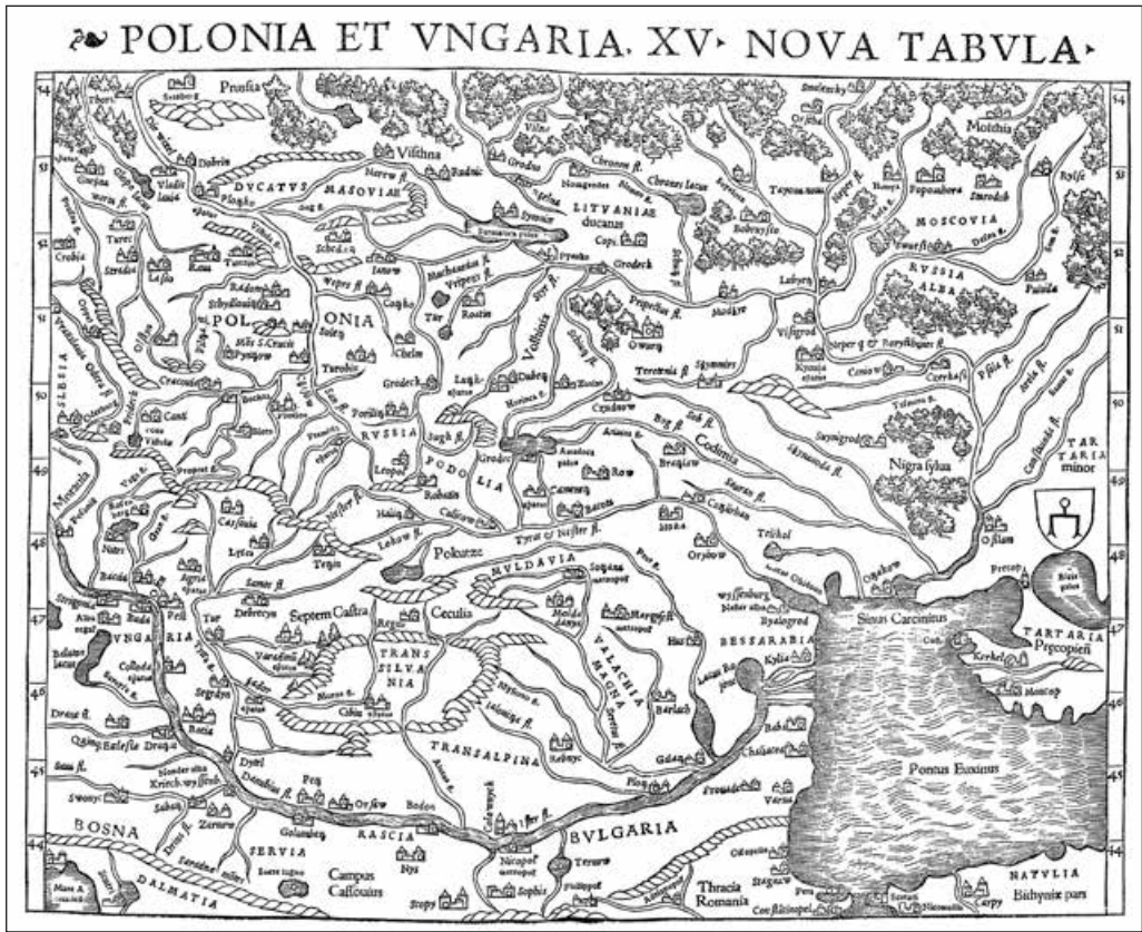
«POLONIA ET VNGARIA XV NOVA TABVLA» («Нова карта Польщі та Угорщини»). 1540 р. Чи не вперше присутні регіональні назви земель: Volhinia (Волинь), Rokutze (Покуття), Rvssia (Русь), Львів (Leopol), Podolia (Поділля), Codimia (Кодимія), Bessarabia (Бессарабія), Tartaria minor (Мала Татарія), Tartaria Przesopren (Перекопська Татарія).