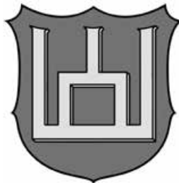
Герб засновника династії Гедиміна (т. зв. Гедимінові стовпи).