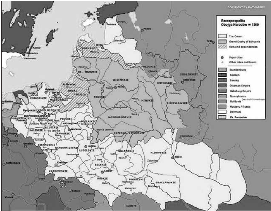
Річ Посполита Обох Народів. 1569 р. Суспільне надбання

до верстви «благородних». Наступне, XVI століття стало століттям кардинальних змін. 1569 р. у Любліні було укладено унію, яка створила «двоєдину державу двох народів» — Річ Посполиту, що об'єднала литовців, поляків та русинів. З точки зору права Люблінська унія «була актом цілком парламентарним, який ухвалено на законодавчій основі за відповідною згодою послів, котрих обирала українська (насправді руська. — Д. Я.) шляхта, єдиний правоспроможний стан тогочасного суспільства». Одним з головних наслідків створення єдиної держави було скасування державного кордону між ВКЛ та РП 1 . Це, в свою чергу, мало наслідком «зняття заборони мешканцям Корони набувати маєтки на колишній литовській частині України (тобто Русі. — Д. Я.), відкрило двері польському елементу <...> на ще не освоєні землі півдня та сходу. <...> Чималі маси шляхти <...> переміщуються з Волині на Київщину та Брацлавщину <...>», причому руські пани «вже нічим не вирізнялись від загальної лави «братії шляхетської».