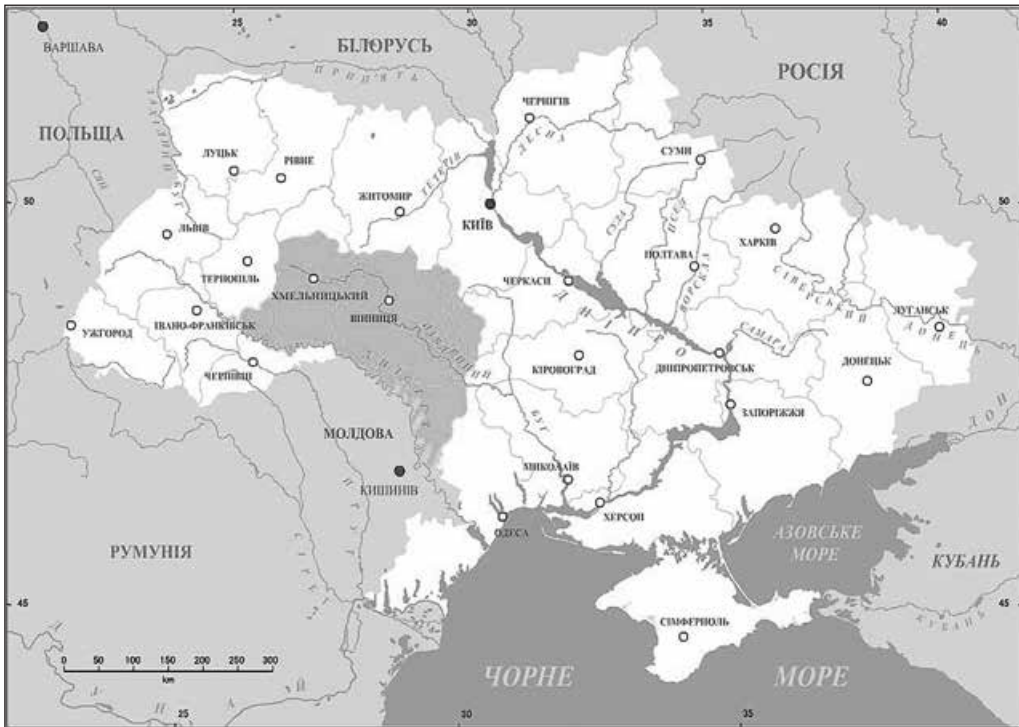
Брацлавщина. Суспільне надбання

Саме князівська верства була реальною владою на території сучасної Західної та Центральної України, «проти яких і уряд, і король, і сейм