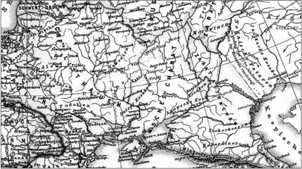
Кримський ханат. 1550 р. Суспільне надбання