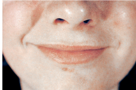
Мал. 2. Губи